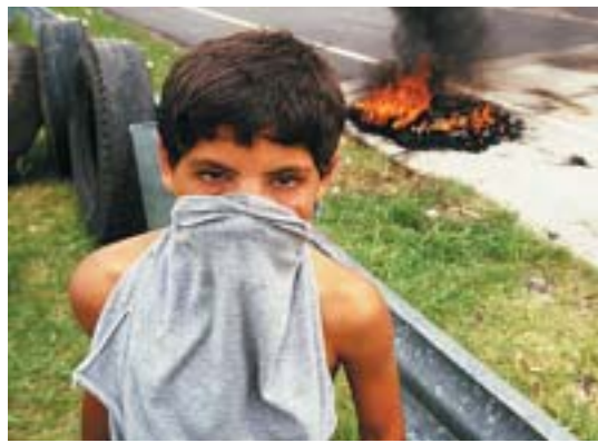
T.v. J 18 i London 1999: Trafalgar Square förvandlas till en åker. T.h. motorvägsblockad i Latinamerika. Bilden nedan från ICC:s läger i Köln 1999.