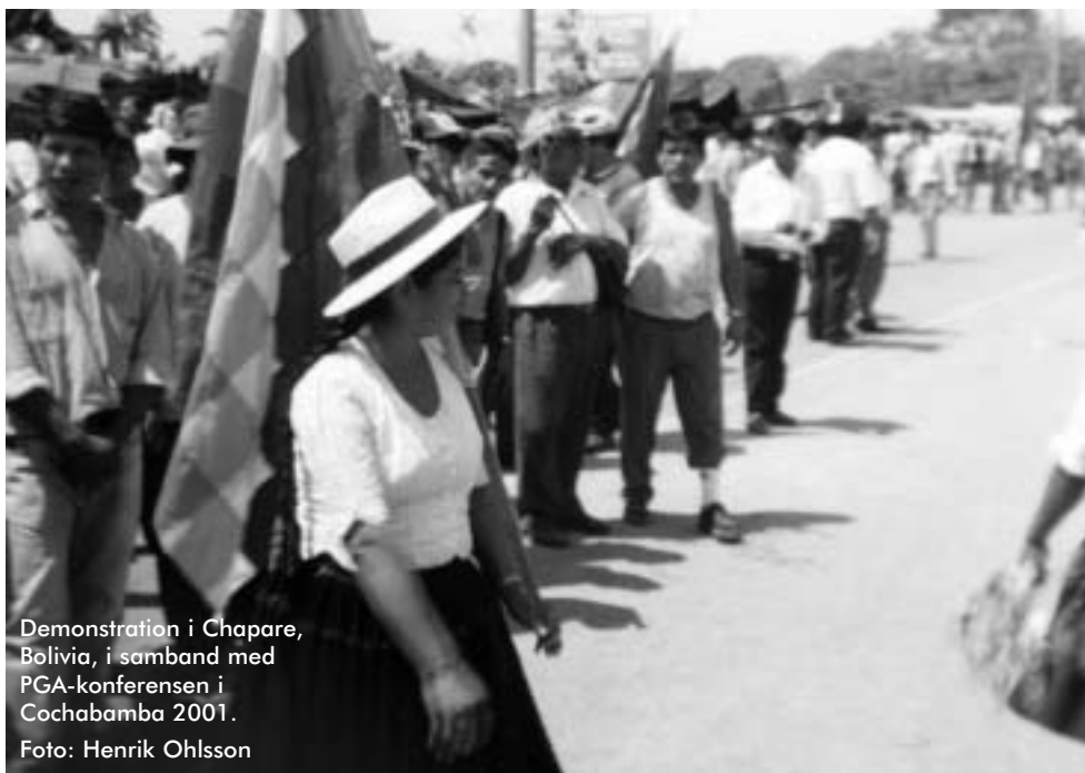
Demonstration i Chapare, Bolivia, i samband med PGA-konferensen i Cochabamba 2001.