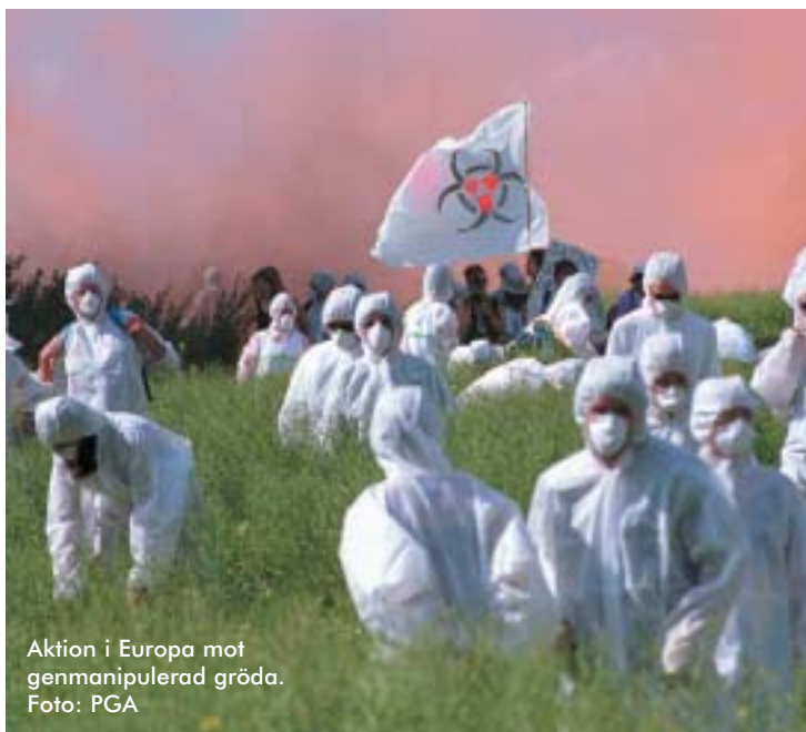
Aktion i Europa mot genmanipulerad gröda.

De senaste årens toppmötesorganiseringar och globala aktionsdagar har uppvisat ett brett spektrum av sociala rörelser och aktivistgrupper i allianser på nationell och internationell nivå. Grupper världen över har inlett samarbeten, tillfälligt eller mer kontinuerligt, med det gemensamt att man är motståndare eller kritisk till "globaliseringen", det vill säga den nyliberala globalisering som huvudsakligen sker på de transnationella storföretagens villkor.